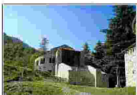
di Claudio Redaelli

Sul monte il canto delle pietre. Le chiese romaniche di Civate candidate per il patrimonio mondiale